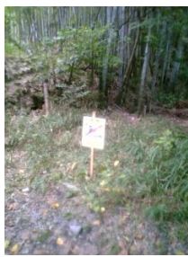
清掃後、看板を設置しています。

ポイントは「誰も悪気がない」うえに、「善意が「ゴミ」の増大を助長した」とことです。「ゴミ」を回収するのも、清掃を業者に委託するのも、税金がつかわれています。地道な清掃活動には時間も労力も必要ですが、日ごろから意識を高くもつだけなら、ノーコストです。みなさんも、短歌を作ってみませんか？いい短歌ができれば、教えてください。