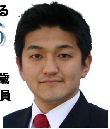
編集・発行／豊中から日本を動かす会